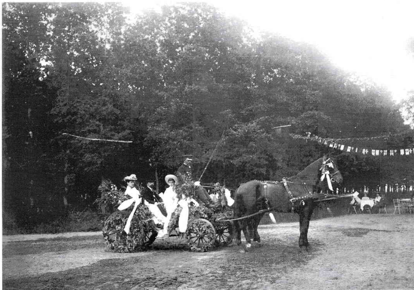
Bătaia cu flori de la Șosea, de 10 Mai, era o tradiție în interbelic. Bineînțeles că doamnele și domnișoarele de bonton n-ar fi lipsit niciodată de la această serbare.